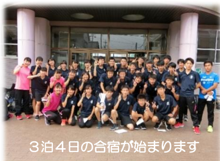
3泊4日の合宿が始まります

長野県伊那市にて (名東高・山田高・菊里高・富田高との5校合同合宿。 そして、地元、飯田高の皆さんとも一緒に練習しました。)