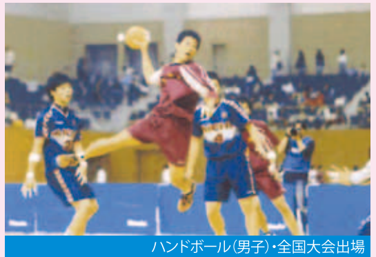
ハンドボール(男子)・全国大会出場