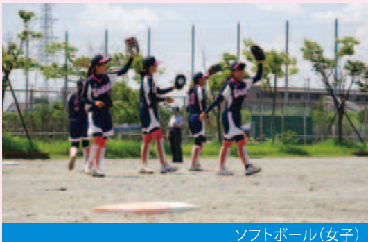
ソフトボール(女子)