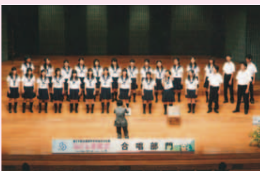
合唱・全国大会出場