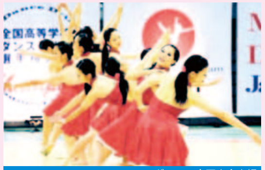
ダンス・全国大会出場