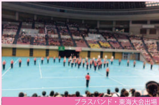
ブラスバンド・東海大会出場