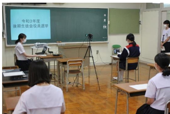
【選挙はTV放送にて実施しました】

今回の選挙では、「ロイロノート」というソフトを使い「タブレットによるweb投票」という新たな取り組みを実施しました。学校現場におけるICT活用は、授業での活用はもちろんのこと、より便利に、他にどんなことに活用できるのかなど、試行錯誤を繰り返しながら実施しています。