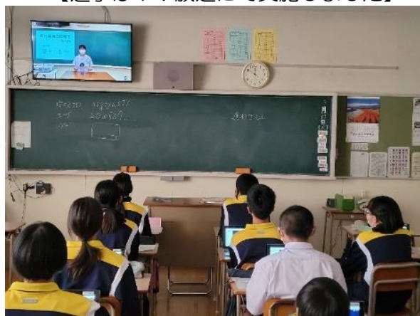
【教室でTV放送を見ている様子】