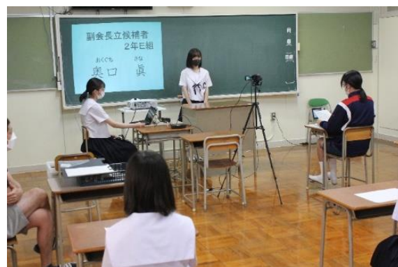
【立候補者が演説している様子】