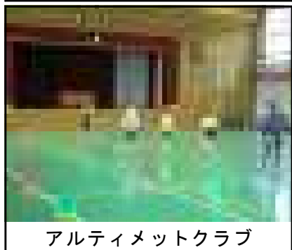
アルティメットクラブ