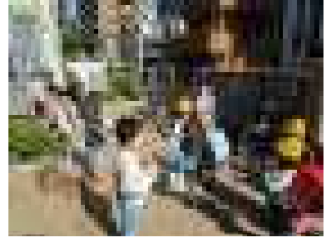
【あいさつ運動の様子】

代表・企画委員会の子どもたちが朝早くから集合し、登校する友達に気持ちのよいあいさつをしたり、募金の呼び掛けを行ったりしました。緑の羽根募金は12,381円も集まりました。これは、地域の美化や学校の緑化活動に使われます。ご協力ありがとうございました。