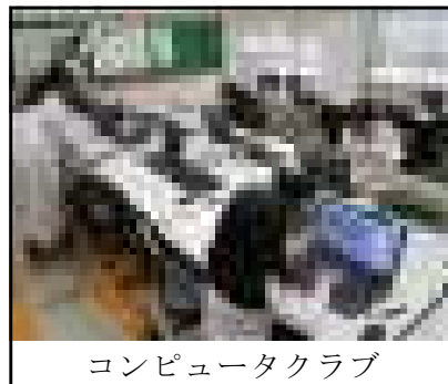
コンピュータクラブ