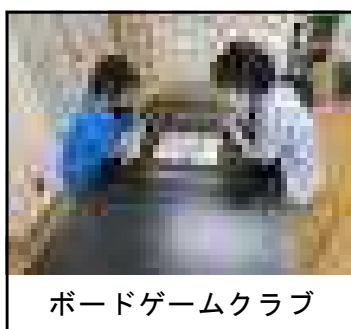
ボードゲームクラブ