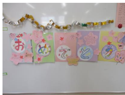
【新1年生を歓迎する 上級生が作った飾り付け】