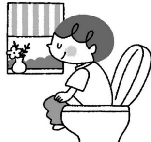
まいあさ はいべん 毎朝きもちよく排便する