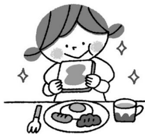
ちようしよく ほじゆう 朝食をたべてエネルギー補充