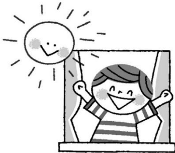
はや お あさ ひ 早起きして朝日をあびる