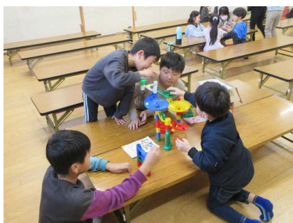
《大人気のくみくみスロープ》