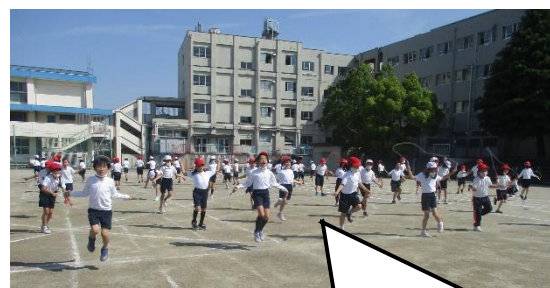
リズムに合わせるの難しいな。