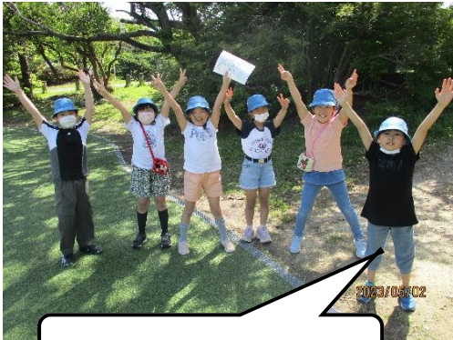
ビンゴ達成したよ。

春みつけビンゴを楽しんだ後は、待ちに待ったお弁当・おやつタイムでした。お弁当をおいしくいただきました。クラスのみなどと外で食べる特別なお昼ご飯に、子どもたちもとてもうれしそうでした。お昼ご飯を食べ終えた子から、長縄飛びやいろいろな種類の鬼ごっこ、ドッジボールなど、クラスの垣根を越えて、大勢で仲良く元気に遊ぶことができました。