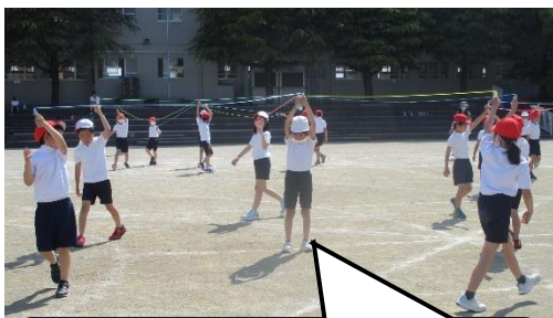
みんなで息を合わせよう。

子供たちは、本番に向けて一生懸命に練習に取り組んでいます。当日は、温かい声援や拍手をよろしくお願いいたします。