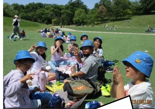
早くお弁当を食べたいよ!