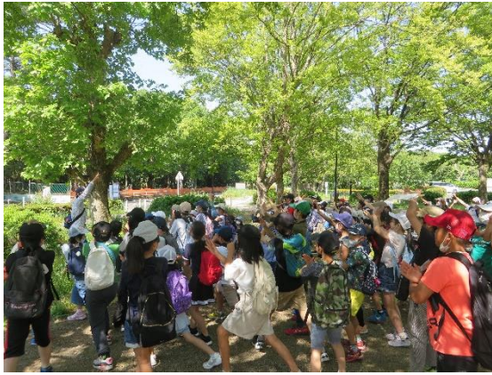
【ペアグループでじゃんけんをして出発!!】

3年生とのペアグループで遠足に行きました。一人一人が相手の気持ちを考えながら行動し、高学年の意識を高めることができました。