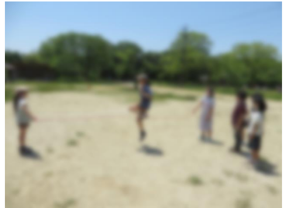
【散策後、3年生と楽しく遊びました】