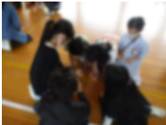
【自己紹介・名刺交換をする様子】