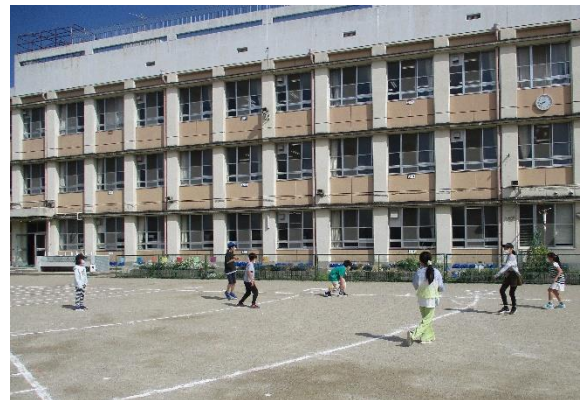
【ペアグループで遊ぶ様子】