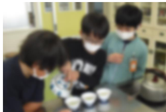
【お茶を入れる実習の様子】