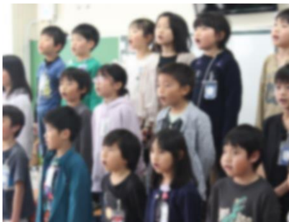
【歌「ぼくのたからもの」】

当日は、1組はおうちの人と一緒に楽しみながらかるたを行いました。2組はおうちの人に向けて、感謝の気持ちを発表や歌で伝えられるように精一杯頑張りました。子供たちの成長を感じ、ぜひ、本番までの頑張りをほめてあげてください。