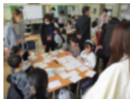
【おうちの人とかるた大会】