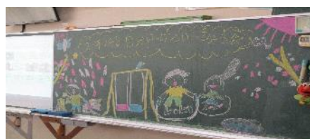
【黒板係の飾り付け】