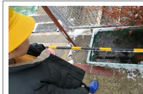
<凍った氷を観察する様子>

☆ 生活科「ふゆとあそぼう」・・・雪の日に校庭を歩き、冬みつけを行いました。雪を触ってみたり、バケツの氷を触ってみたりして、冬を楽しみました。