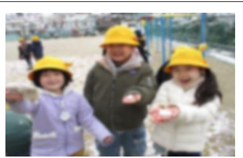
<雪を触って遊ぶ様子>

☆ 生活科「昔遊び」・・・「あやとり」「けん玉」「羽子板」「こま」等、昔遊びを通して冬の行事や遊びについて学習しました。昔遊びを初めてする子が多く、回数を重ねるごとに技を習得して教え合いながら楽しく活動する姿が見られました。