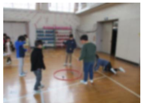
<コマ回し競争をする様子>