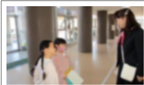
<インタビューしている様子>

☆ 国語の学習で、学校で働く人にお話を聞きに行きました。聞いてきたことをメモにして、メモをもとにみんなの前で発表しました。小幡北小学校には、いろいろなお仕事をする人がたくさん働いていることを知りました。また、挨拶の仕方や丁寧な話し方も学習しました。