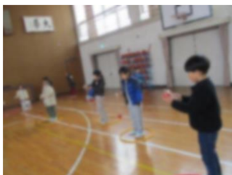
<けん玉の技に挑戦する様子>

☆ 生活科「昔遊び」・・・「あやとり」「けん玉」「羽子板」「こま」等、昔遊びを通して冬の行事や遊びについて学習しました。昔遊びを初めてする子が多く、回数を重ねるごとに技を習得して教え合いながら楽しく活動する姿が見られました。