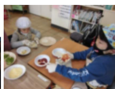
オイル、ケチャップを塗った後、ピーマン、ハム、チーズをのせました。