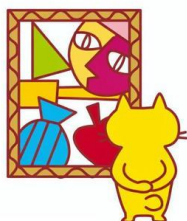
「きらめき展」に出品する作品を作りました。黒い画用紙に模様を描き、チョークで色を塗りました。