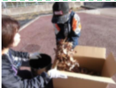
落ち葉と芋を入れて