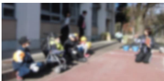
校長先生や教頭先生、河野先生も参加してくださいました

1月の誕生日会をしました。調理のメニューは「ギョウザの皮ピザ」です。具を好きなようにのせて、自分のピザを作りました。