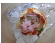
チーズ多め、ピーマン少なめ、とにかく大盛り… など個性豊かなピザが出来上がりました。