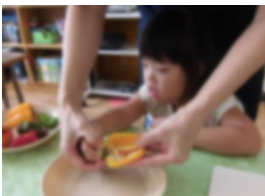
種を取って細く切りました。

今年度、学級の畑にピーマン・パプリカを植えました。1学期末に緑色のパプリカとピーマンの食べ比べをしました。今回は、黄色いパプリカ・緑ピーマン・赤ピーマンの食べ比べです。(※赤ピーマンは緑ピーマンが熟した物です)