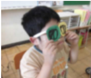
目隠しをして、試食中。(違いが分かる小学生たち②)