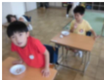
3種類を食べ比べ中。歯ごたえ、におい、味はどうか。(違いが分かる小学生たち①)