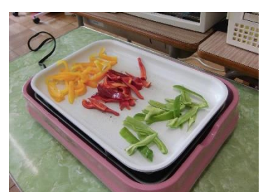
カラフルな焼き野菜たち