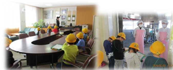
【学校で働く人にインタビューをしました！】