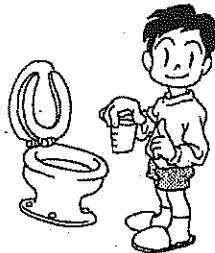
じんぞうけんしん (にょうけんさ) 腎臓検診 (尿検査)