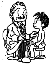
ないかけんしん 内科検診