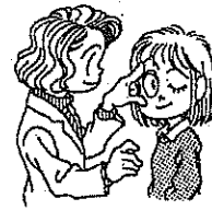
がんかけんしん 眼科検診