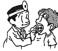
しかけんしん 歯科健診