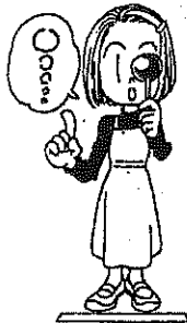
しりょくけんさ 視力検査