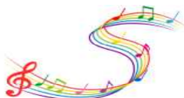
【NHK全国学校音楽コンクールに参加（市民会館）】