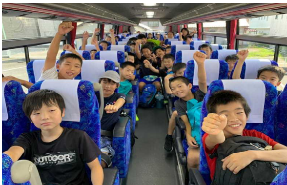
【貸し切りバスで会場へ】

9月7・8日に名古屋市指導会が行われます。(千種スポーツセンター)男子、女子、どちらも公式戦初勝利を目指して取り組みます。応援よろしくをお願いします。