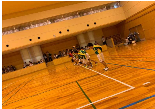
【市民スポーツ祭の様子】