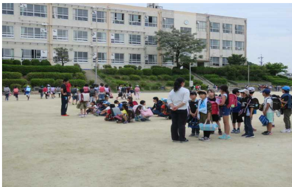
＜4年生の集合の様子＞

不審者等からの危険を回避するために集団で下校することを想定し、①学年で集合、②方面別に下校する訓練を実施しました。