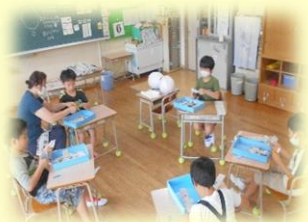
つばめ・ちどり「気球にのって」

作品展 では、新型コロナウイルス感染症の感染拡大防止のため、様々なお願いをしましたが、ご理解とご協力をいただき、ありがとうございます。子どもたちは、構想から完成まで一生懸命作品の製作に取り組みました。