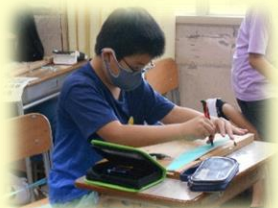
4年「ほってすって見つけて」