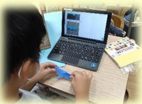
5年「形が動く・絵が動く」