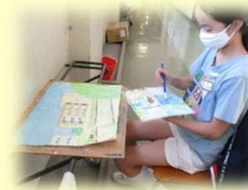
6年「わたしの大切な風景」

各学年の製作の一場面です。 子どもたちのすてきな作品は、ぜひ作品展でお楽しみください。