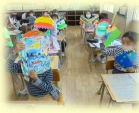
2年「ふしぎなたまご」