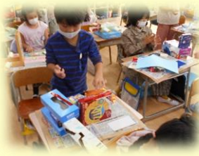
1年「はこでつくったよ」