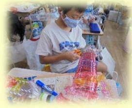
3年「クリスタルアニマル」