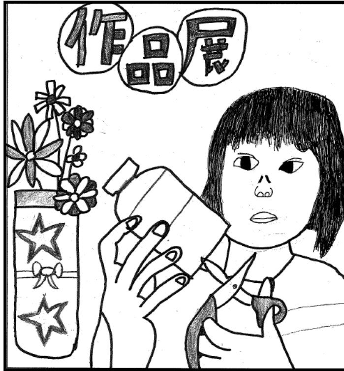
6年 一柳 瑠唯

とき 令和4年 11月 9日(水)、10日(木)、11日(金) 16:00~18:45 (入場は18:30まで)