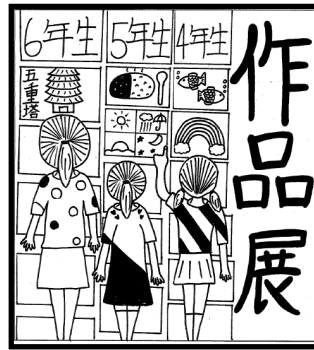
6年 野々山 陽葵