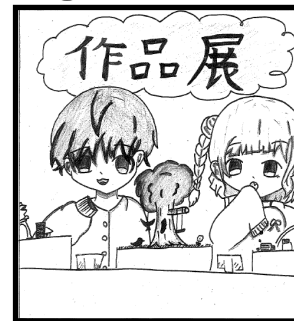
6年 風岡 みのり