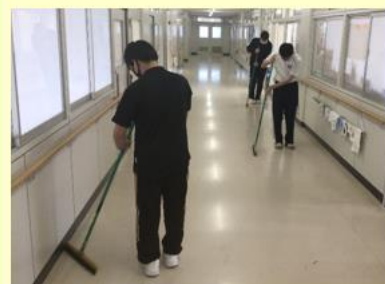
〈職業科：クリーンサービス〉