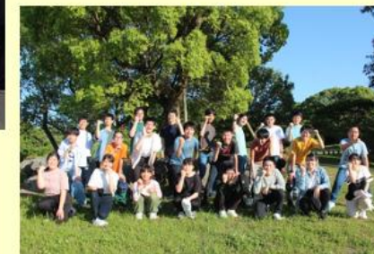
〈オリエンテーション宿泊学習〉