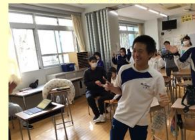
〈生涯学習：音楽・ダンス〉