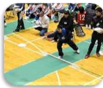
フライングディスク部