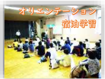
オリエンテーション 宿泊学習