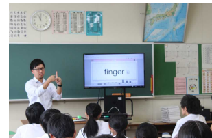
【タブレットを活用した英語授業】

保護者の方からの回答として唯一「3」を下回り、平均値「2.82」という厳しい数字をいただきました。学習に対する心配の表れであると推察します。学校として、ねらいを明確にした授業、話し合いや認め合いを重視した授業、ICT機器を活用した分かりやすい授業などを目指し、研修や実践を進めています。その成果もあつてか、同じ項目で生徒からの回答では平均値「3.34」となっています。これからも保護者の皆様にも信頼される授業を目指してまいります。