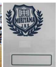
【アイロンプリント名札】