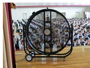
【猛暑対策の大型ファン】

今年度、猛暑時季の対策として、体操服と制服の選択制を行いました。概ね好評でしたが、「大きなゼッケン」で体操服登校することへの安全面での不安の声がありました。校内で検討し、来年度の1年生より、小型化したアイロンプリント名札(右写真)へと変更します。(2・3年生については、従来のものも使用可能です)また、制服の名札においても名札カバーを正式に認めていきます。また、クラスバッジのクラス表示をやめ、学年色の校章へ変えていきます。