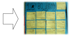
【ありがとうを伝える】