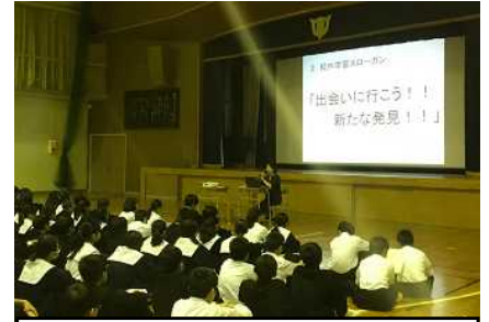
(オリエンテーションの様子)

6月19日(水)に、1年生が校外学習に出掛けます。校外学習では、野外民族博物館リトルワールドに出掛け、国際理解学習と同時に野外炊事(焼きそばづくり)に取り組みます。また、6月17日(月)から2泊3日の予定で、3年生は修学旅行に出かけます。主な日程は次のようになっています。