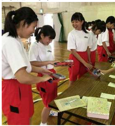
(握力に取り組む2年女子)