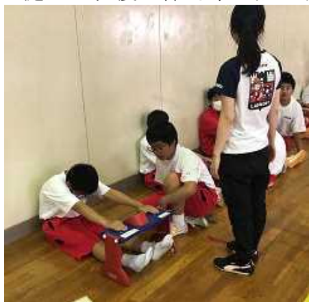
(長座体前屈に取り組む1年男子)

5月15日(水)薄曇りの空の下、全校生徒が運動場で3種目(50m走、ハンドボール投げ、立ち幅跳び)、体育館・格技場で4種目(反復横跳び、上体起こし、長座体前屈、握力)の計7種目の体力・運動能力調査に、カー杯取り組みました。出た記録に対して、喜んだり、悔しがったりしている姿がいろいろな種目で見られました。体育の授業で実施した持久走(男子1500m、女子1000m)を加えた8種目の記録の得点が基準を越えた生徒には、後日体力章が贈られる予定です。