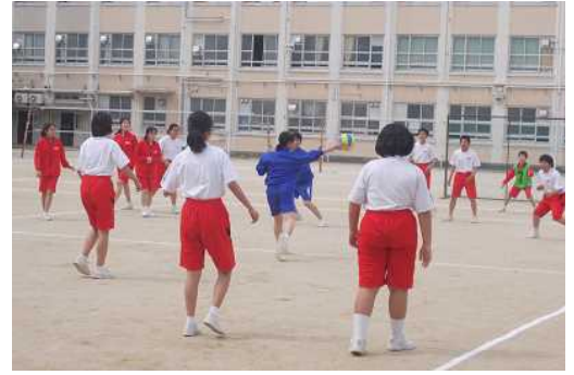
(ドッジボールの様子)

5月10日(金)、2年生が球技大会を行いました。種目はドッジボールでした。1年生の時よりも、速い球が投げられるようになっており、白熱した戦いが繰り広げられました。順位に関係なく最後まで楽しめた球技大会でした。準備から片付けまで、リーダー会を中心として、みんなで協力することができました。