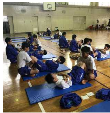
(上体起こしに取り組む3年男子)