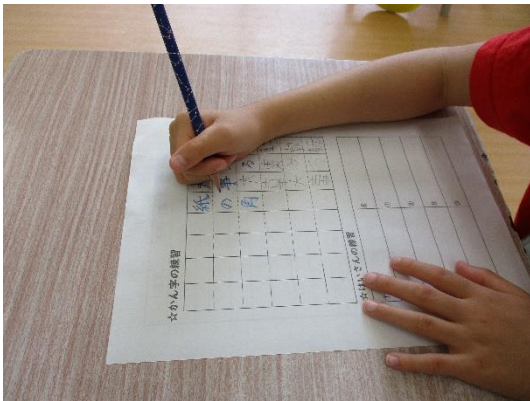
手本をなぞってから練習します。

プリントは毎日ファイルにとして持ち帰っているので、確認していただけていると存じます。時折、ご家庭でも話題にしていただけると励みになるとと思います。