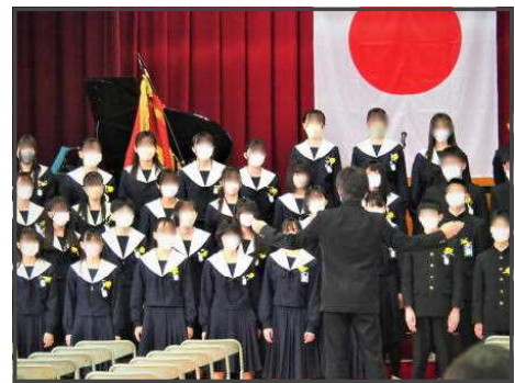
3年生 卒業の歌「あなたへ」