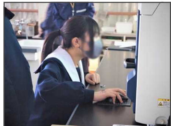
電子顕微鏡を操作する生徒

その後、何人かの代表生徒が実際に電子顕微鏡を使用して、植物の葉やICチップなどを観察する体験を行いました。生徒たちは、次々にスクリーンに映し出される1万倍以上の拡大映像に、驚きの声をあげていました。