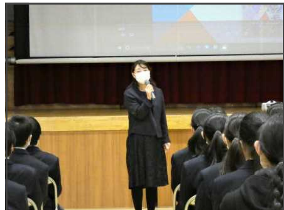
生徒に話しかける講師の方

今回、この講演会で学んだ内容を、他人事ではなく自分事としてとして考え、今後の自分自身の言動を見つめ直すきっかけにしてほしいと思います。