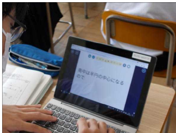
(3年生) 理科の授業のまとめの様子

☆ この学校だよりは、学校ホームページでも閲覧することができます。また、ホームページでは「南天白中のアルバム」というコーナーで、月1回、生徒の活動をより詳しく掲載しています。