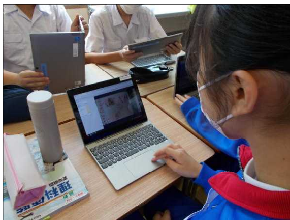
(2年生) 校外学習のしおりの表紙絵選びの様子