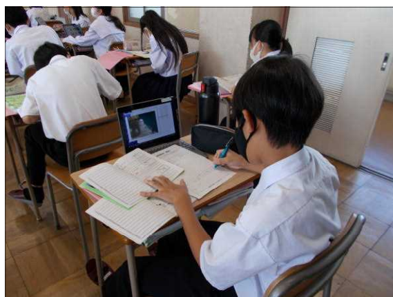
(1年生) 校外学習のまとめの様子

情報活用能力を育成し、様々な学び方を習得できるように、指導をしていきたいと考えています。