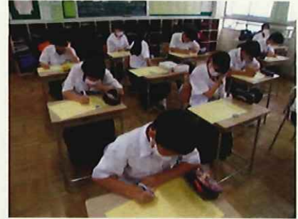
学習計画を立てる1年生

7月3日(金)の6時間目、1年生はテスト計画表の作成を行いました。テスト計画表作成は初めてのなので、どの生徒もいろいろ迷いながら作成していました。先生から「その日、その教科はどのくらいの範囲をやるの? 時間はどのくらいかけるの?」などアドバイスを受けながら作成をしていました。このような活動を通して、計画的に学習を進める姿勢を身に付けてほしいと思います。