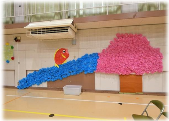
会場の体育館の装飾 ②