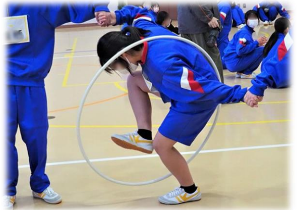
フラフープくぐり ②