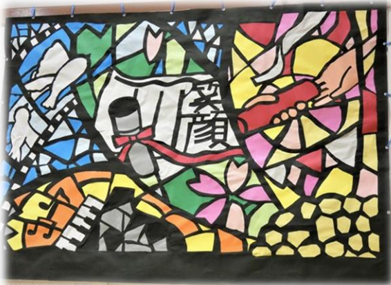
会場の体育館の装飾 ⑤(2年生作成の切り絵)