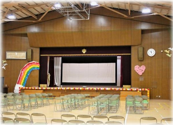
会場の体育館の装飾 ①