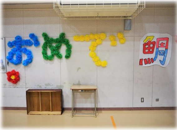
会場の体育館の装飾 ③