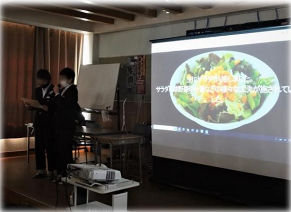
職場で行われている工夫についての説明