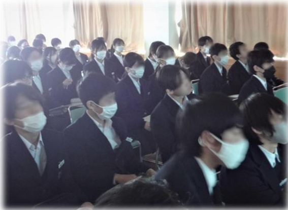
発表に聞き入る生徒