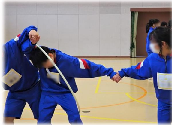
フラフープくぐり ①