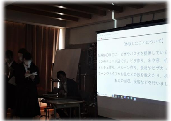
自分たちの活動した内容の説明