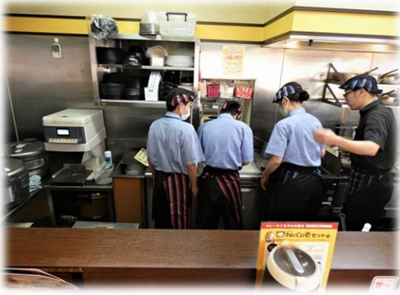
飲食店での体験の様子