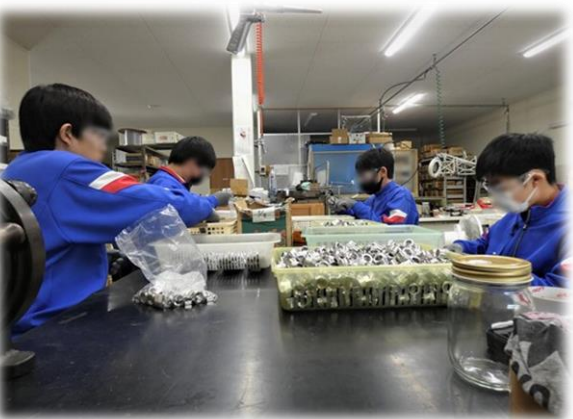
部品工場での体験の様子