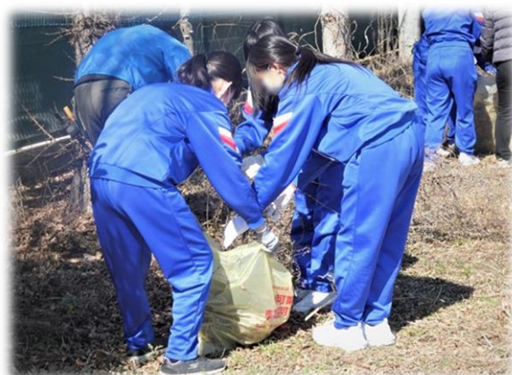
運動場周辺の草抜き ②