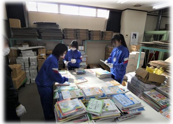
教材販売会社での体験の様子