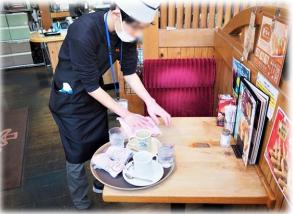
飲食店での体験の様子