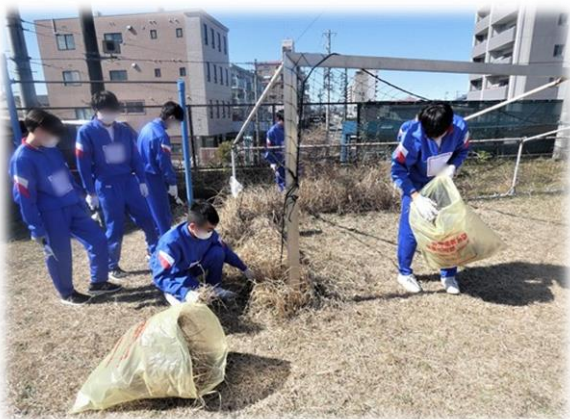
運動場周辺の草抜き ①