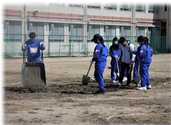
運動場への土入れ ①