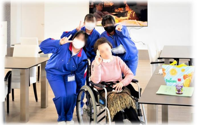
老人ホームでの体験の様子