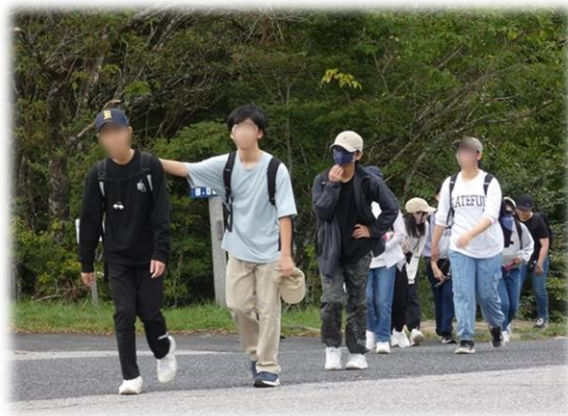
ハイキング ② 面の木園地に到着