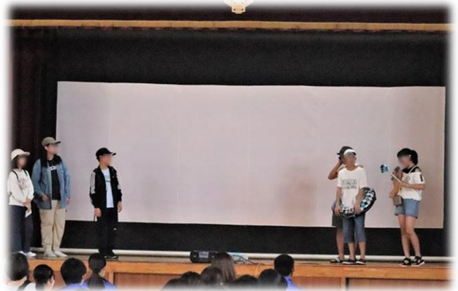
リーダー会からの当日の服装についての説明