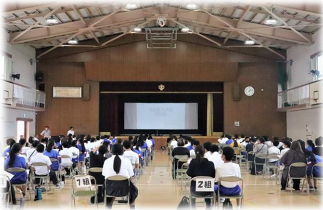
説明会は生徒と保護者が同席で実施しました