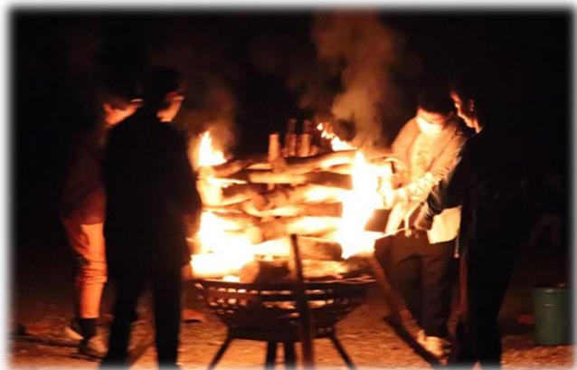
キャンプファイヤー ② レクリエーションの様子