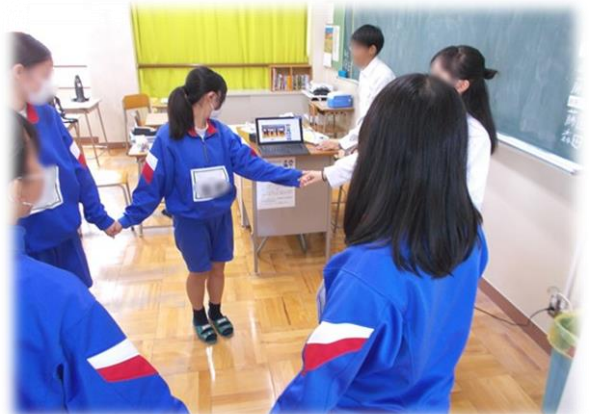
キャンプファイヤー実行委員によるダンスの練習