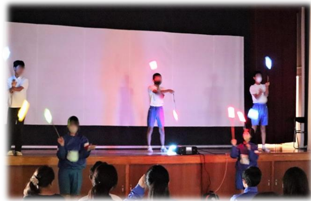
トーチトワリングの実演