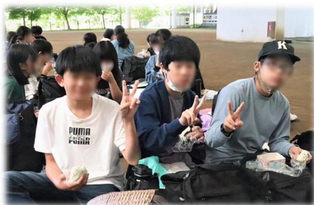
多目的広場での昼食