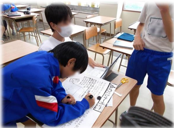
レクリエーション委員の活動