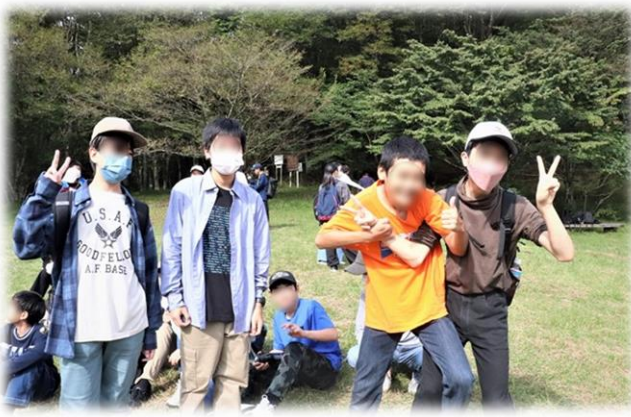
ハイキング ③ 面の木園地での様子