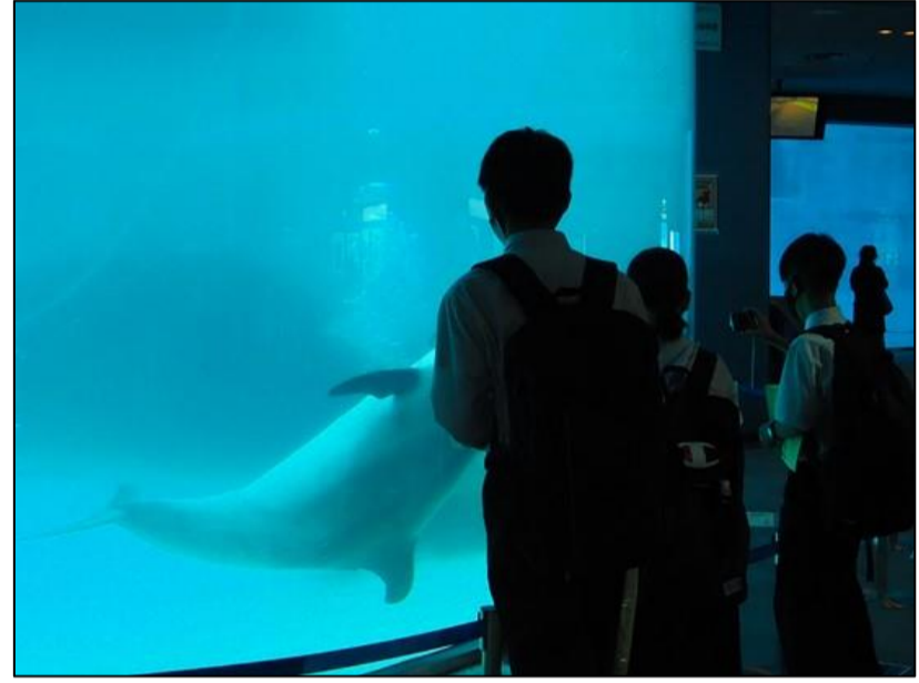
午前中の班ごとの見学。イルカを間近に。