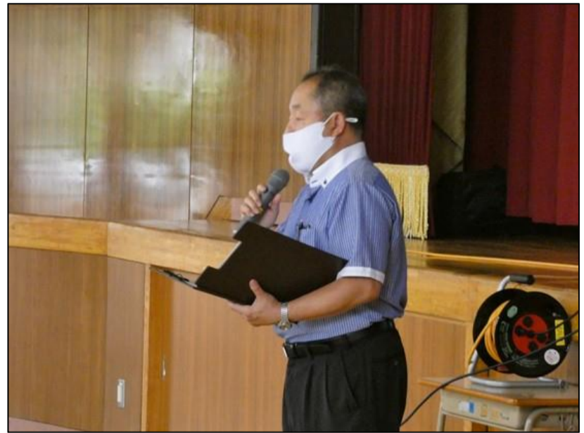
校長先生のあいさつ。