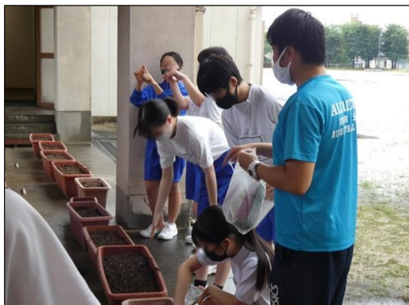
生徒会の生徒が植え方を説明しました。