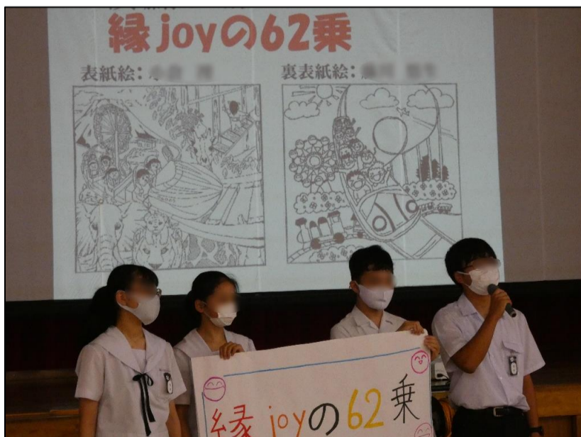
しおりの表紙絵・裏表紙絵の発表。