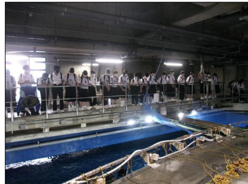
黒潮大水槽を真上から眺めました。