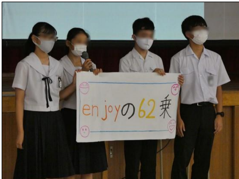
リーダー会からのスローガンの発表。