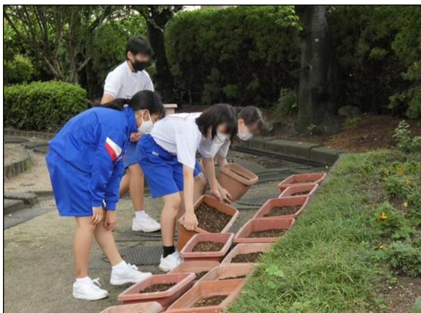
通用門近くの花壇にプランターを運びました。