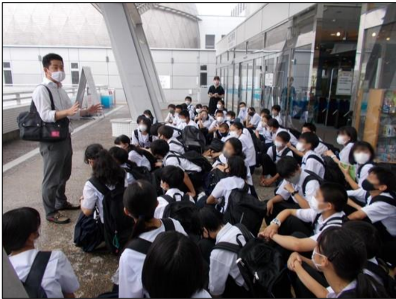
名古屋市水族館に到着した時の様子。