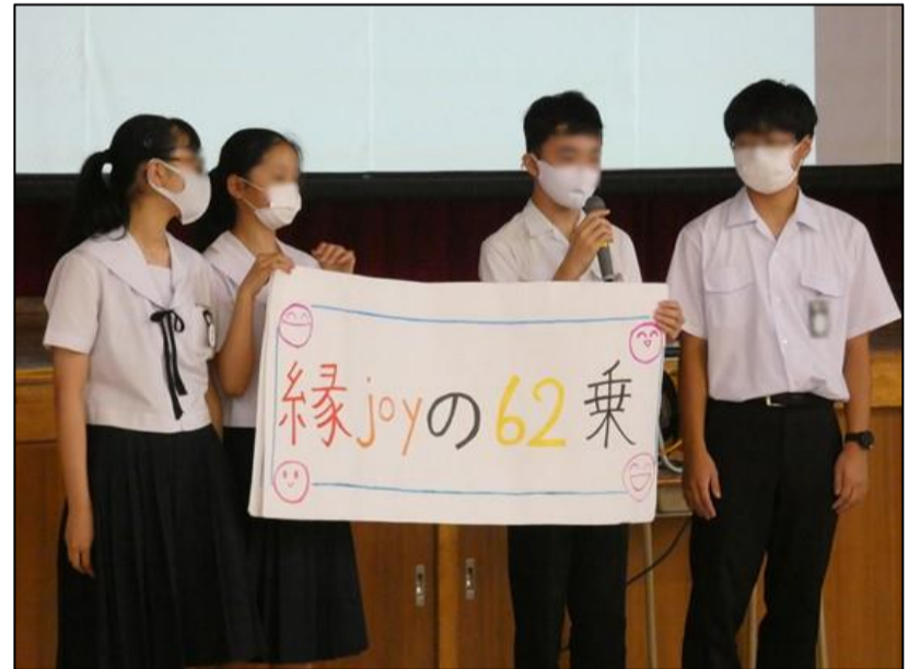
enjoyのenと縁をかけてたんですね。