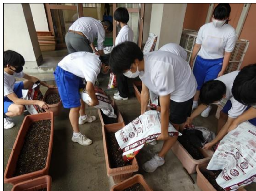
種を一つ一つ植えていきます。