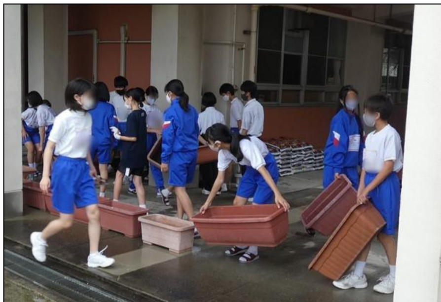
渡り廊下にプランターを並べます。