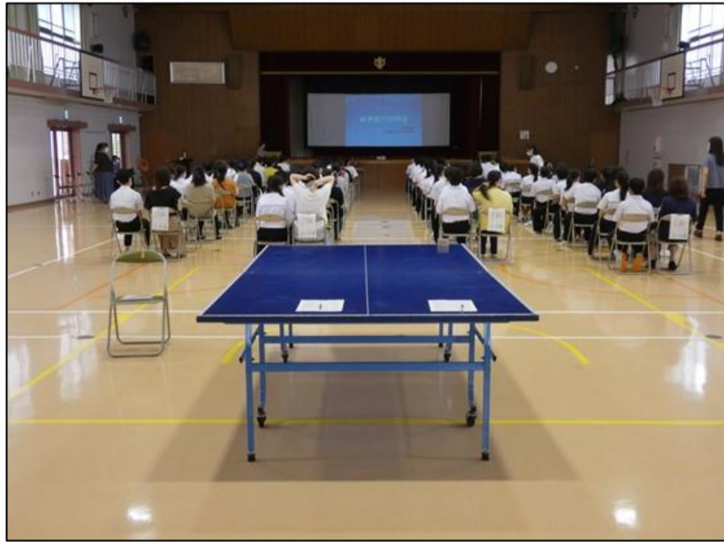
保護者・生徒が参加して行われました。