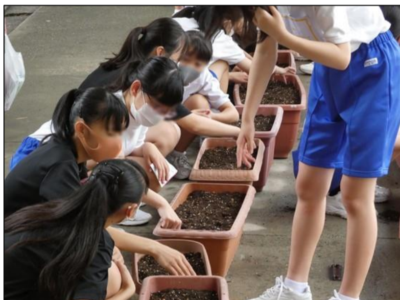
種を一つ一つ丁寧に植えていきます。