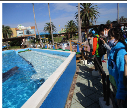
【イルカを眺める様子】

南知多ビーチランドでは、泳いでいるペンギンを楽しそうに見たり、自分の間近にやってくるイルカに手を振ったりして、海の生き物に興味をもって楽しみました。クマノミやエビなど、なじみのある生き物を見付けると、指さしながら「これみて」と身振り手振りを交えながら話をする姿も見られました。イルカショーでは、水しぶきにびっくりしながらも、大迫力のジャンプにくぎ付けでした。イルカやアシカがジャンプしてボールにタッチする場面では、思わず「おお〜!」と歓声が上がっていました。