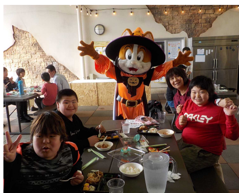
【キャラクターと楽しむ様子】

当日は一人一人に合わせてオーダーメイドしたしおりを見て予定を確認しながら、事前学習を生かして、竹島水族館やラグナシアの活動を楽しむことができました。竹島水族館では、発見した生き物の写真をしおりに貼ったり、実際に生き物に触ったりしました。ラグナシアでは、ペースに合わせて2グループに分かれ、それぞれお目当てのアトラクションに乗りました。食事の際には、キャラクターも登場して、大変盛り上がりました。