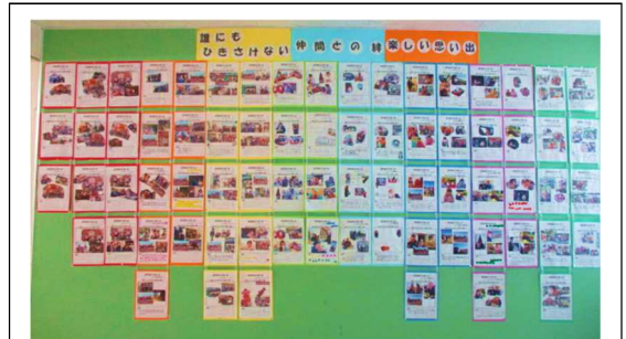
【振り返り学習の掲示物】

活動内容について考えたり、友達と話し合ったりしながら、楽しい一日になるように計画を立て、心に残る体験をすることができました。