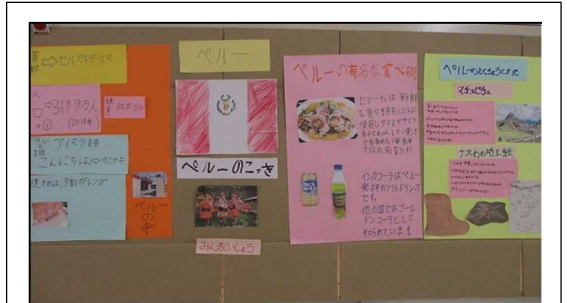
【事前学習のパネル】

世界の国々の建物や資料を見たり、飲食物を味わったりして、目を輝かせながら、世界の文化に触れた一日になりました。