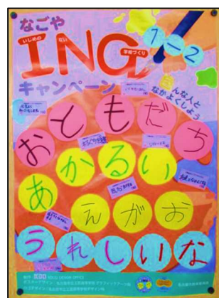
【生徒が作成したポスター】

名古屋市教育委員会では、子どもが自らいじめをなくしていくとする意識を高めるために、「なごやINGキャンペーン」を実施しています。本校では、正面玄関、分校では職員室前廊下に「INGフラッグ」を掲示したり、各学級で「オリジナルポスター」を作成したりして、いじめのない学校づくりに取り組む意思を確認しています。お子様が笑顔で過ごせる学校を目指しています。