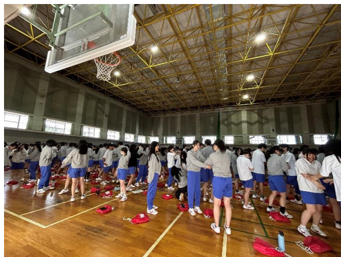
実際に体を動かしながら