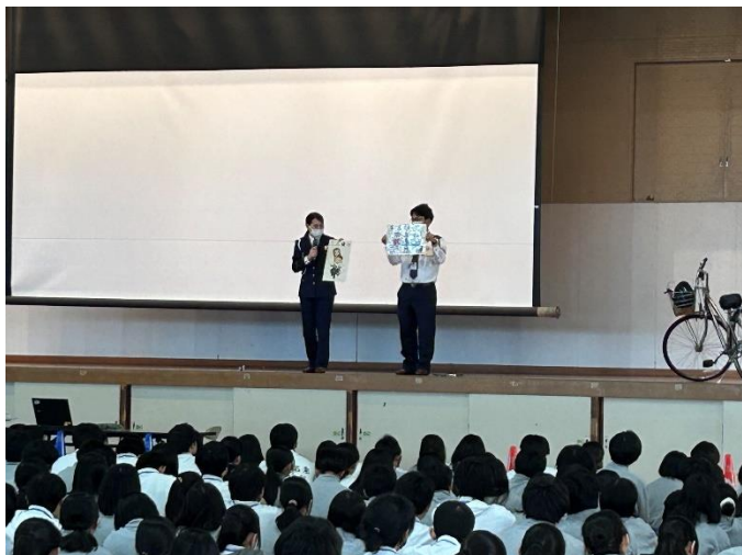
自転車でも違反をすると罰金は高額！

本校は自転車で通学する生徒も多く、事故に巻き込まれて被害者にならないようにするとともに、歩行者と事故を起こして加害者にならないためにも、自己の交通道徳を見直すよいきっかけとなりました。また、SNSをめぐるトラブルやフィッシングメール・闇バイトの誘いなど、身近に潜む危険を避ける自己防衛のための手がかりも得られ、防犯意識が高められました。