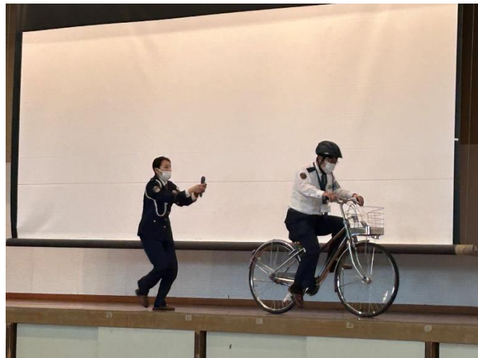
イヤホンしていると聞こえない