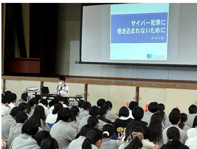
フィッシングメールなどに注意