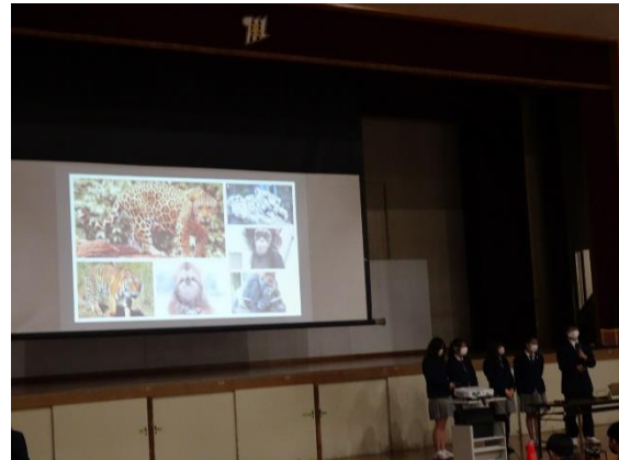
環境問題についての発表