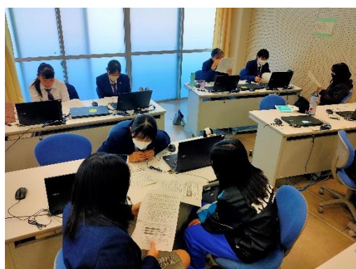
入試問題（テーマ：難民）に挑戦