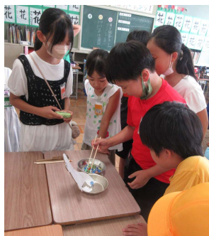
<あざらしグループ> 「あざらしのビー玉うつし」