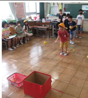
<ぞうグループ> 「ぞうのはなでシュート」

紙面のスペースの都合上、全グループのお店の様子を載せることができませんが活動の様子を掲載させていただきます。