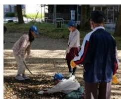
【清掃している様子】

先日の地域清掃では、子どもたちと地域の方々と一緒に、正木公園を掃除しました。「公園がきれいになって気持ちよかった」という声が6年生の子どもから聞かれ、最高学年としての意識の高まりを感じました。