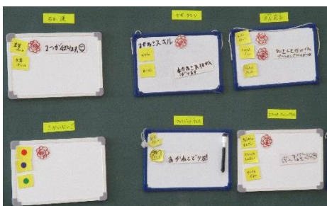
[子どもたち一人一人の計画ボード]

自身で選択したり、教え合ったりする学習を継続的に続けたことで、今では「今日はたくさんできそうなので、かけ算の勉強もしたいな。」「この問題から今日は頑張るぞ!」と考えながら選択することができるようになりました。また、教え合い活動では、全部できたら児童同士でハイタッチをしたり、大きな花丸を書いたりするなど、励まし合う姿が多く見られるようになりました。