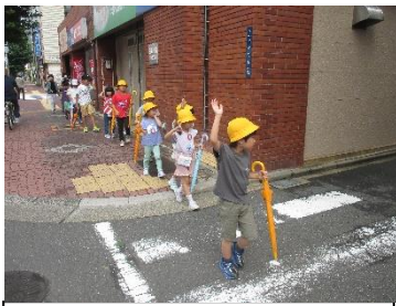
歩行訓練を行う児童