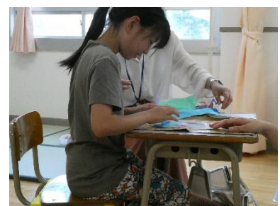
ひまわり図工「きらきらひらひら」