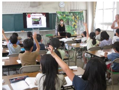
3年「明治」出前授業「チョコレートができるまで」