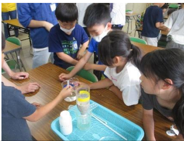
4年水道局出前授業「水はどこから」