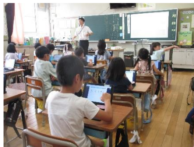
2年国語「この間に何があった？」