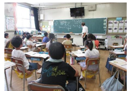
3年道徳「生きている仲間」