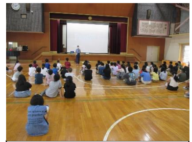
自転車の乗り方を学ぶ児童

低学年は、学校周辺の歩道や横断歩道を利用して歩行訓練を行いました。「安全な歩き方」について、交通指導員さんのサポートのもと、学ぶことができました。