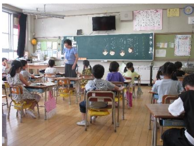
1年道徳「わすれていることなあい」