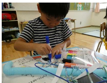
ひまわり図工「きらきらひらひら」