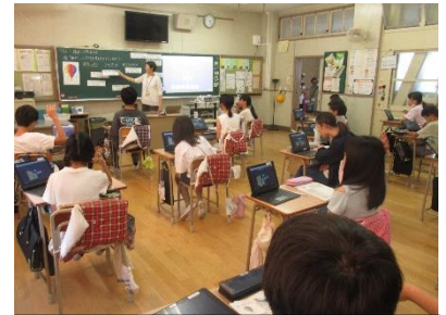
6年道徳「権利の熱気球」