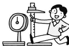
体や心のことが知りたい時