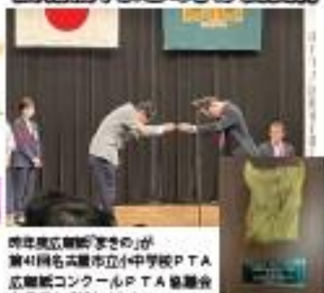
昨年度広報紙「まきの」が第41回名古屋市立小中学校PTA広報紙コンクールPTA協議会会長賞を受賞しました!