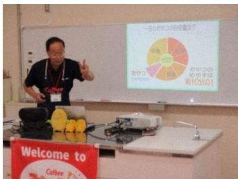
〔カルビースナックスクール〕