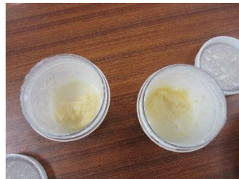
〔手作りバター完成！〕