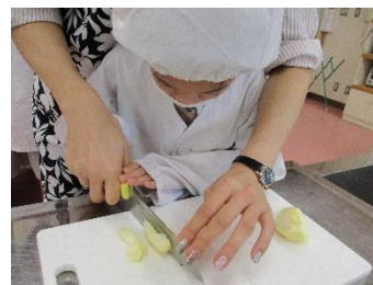
〔かんたんクッキング〕