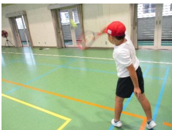
〔テニスにチャレンジ！〕