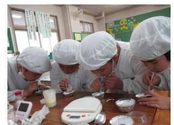
〔ホエーはどんな味かな〕