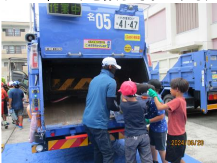
大きくて固い家具が押しつぶされた!

6月20日(木)に環境事業所の方々にお越しいただき、ごみの処理や分別について学びました。実際に粗大ごみをごみ収集車に入れたり、ごみ収集車に乗ったり、ごみ回収をしている人たちに質問したりして、ごみを減らそうとする大切さに気付くことができました。