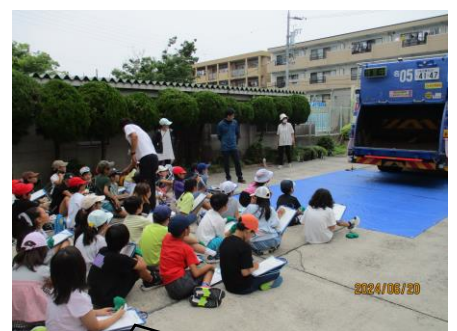
ごみ収集車について質問をしたよ!