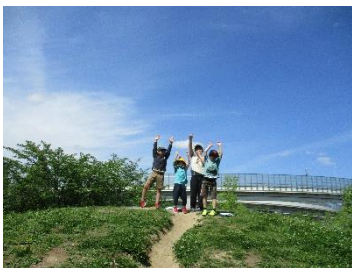
〔お山の上にたどり着いたよ〕

5月2日に牧野ヶ池緑地公園へ遠足に行きました。目的地を示したハイキングカードや、生き物を探すネイチャービンゴに取り組みながら、自然と親しむ姿が見られました。