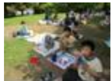
〔みんなで食べるとおいしいね〕