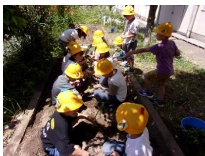
おいものなえうえ