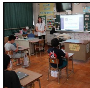
今日の学びを振り返る