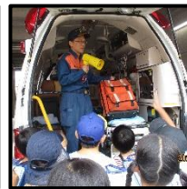
救急車には何がある

名古屋市全体の取り組みとして、「キャリア教育の充実」を目指しています。「キャリア教育」とは、一人一人の社会的・職業的自立に向け、必要な基盤となる能力や態度を育てることを通して、キャリア発達を促すことを目的としています。