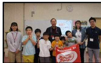
学習を終えて記念撮影

「3時のおやつ」というけれど、本当にそうなのでしょうか。また、どれくらい食べると良いのでしょうか。という講師の方の問いから始まった授業。子どもたちはポテトチップスの成分量を学んだり、実際におやつを食べるにはどれくらいの量が適切なのかを学んだりしました。自分の食生活を振り返るきっかけとなりました。