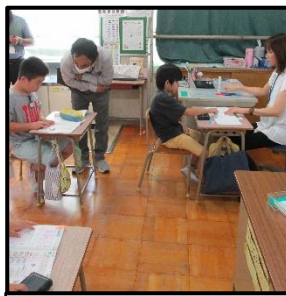
自分で学びを選ぶ

努力点授業だけでなく、様々な場面で学び方を学ぶ姿が見られます。また、学習を積み重ねてきた子どもたちへ、「学習の振り返り」の重要性も指導しています。児童が自らの学びを見つめ直し、「何ができて」「何ができていない」かを振り返り、次の学習や、他の教科・領域の授業で学習を進められる児童を育てていきたいと思えます。