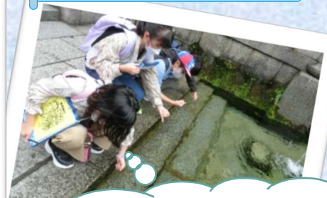
願い事がかないますように…。