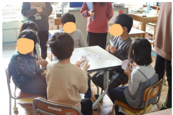
②「友達と声を掛け合いながら、 ババ抜きをしている様子」