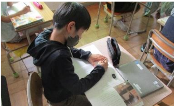
①想像した登場人物の気持ちを、根拠を明らかにしながら記述する児童の様子