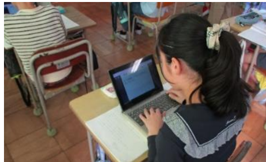
②「国語の学習」に記述した自分の考えをロイロノートで提出する児童の様子